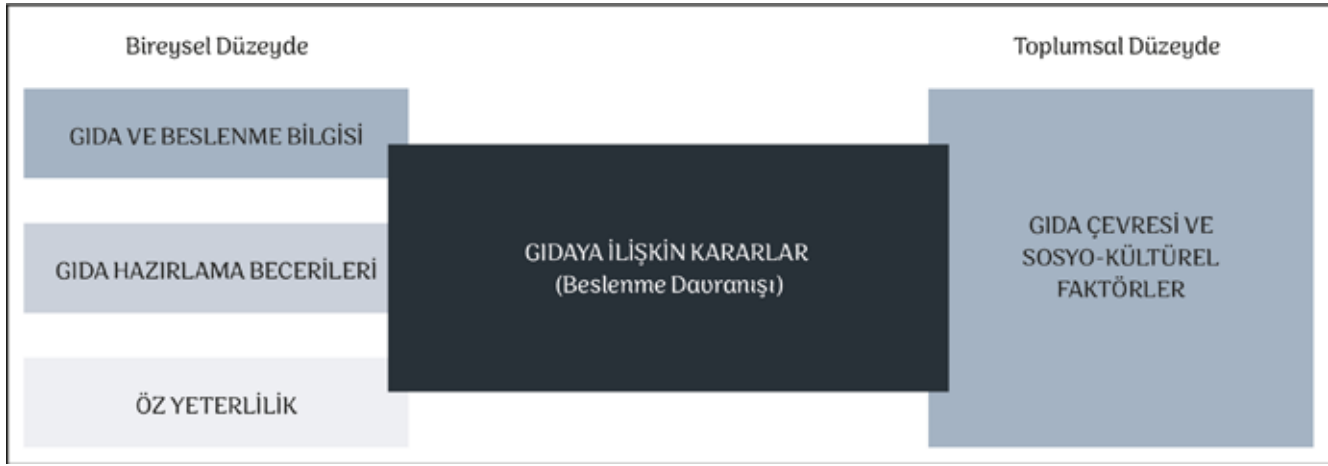
Şekil 4: Türkiye Gıda Okuryazarlığı Eylem Planı Bileşenleri (Kaynak: Ontario, Kanada LDCP Sağlıklı Beslenme Ekibi tarafından oluşturulan "Gıda Okuryazarlığı Çerçevesi" (2018) temel alınmıştır.)